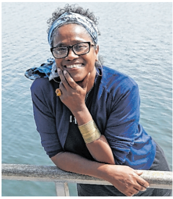
Kettly Mars zählt zu den wichtigsten Autorinnen Haitis.