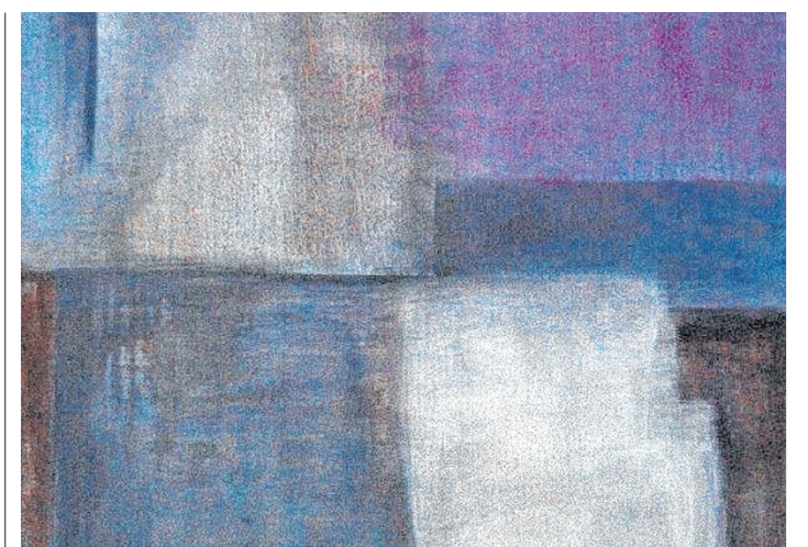
Eines der Bilder (Ausschnitt) von Anna Maria Mackowitz.