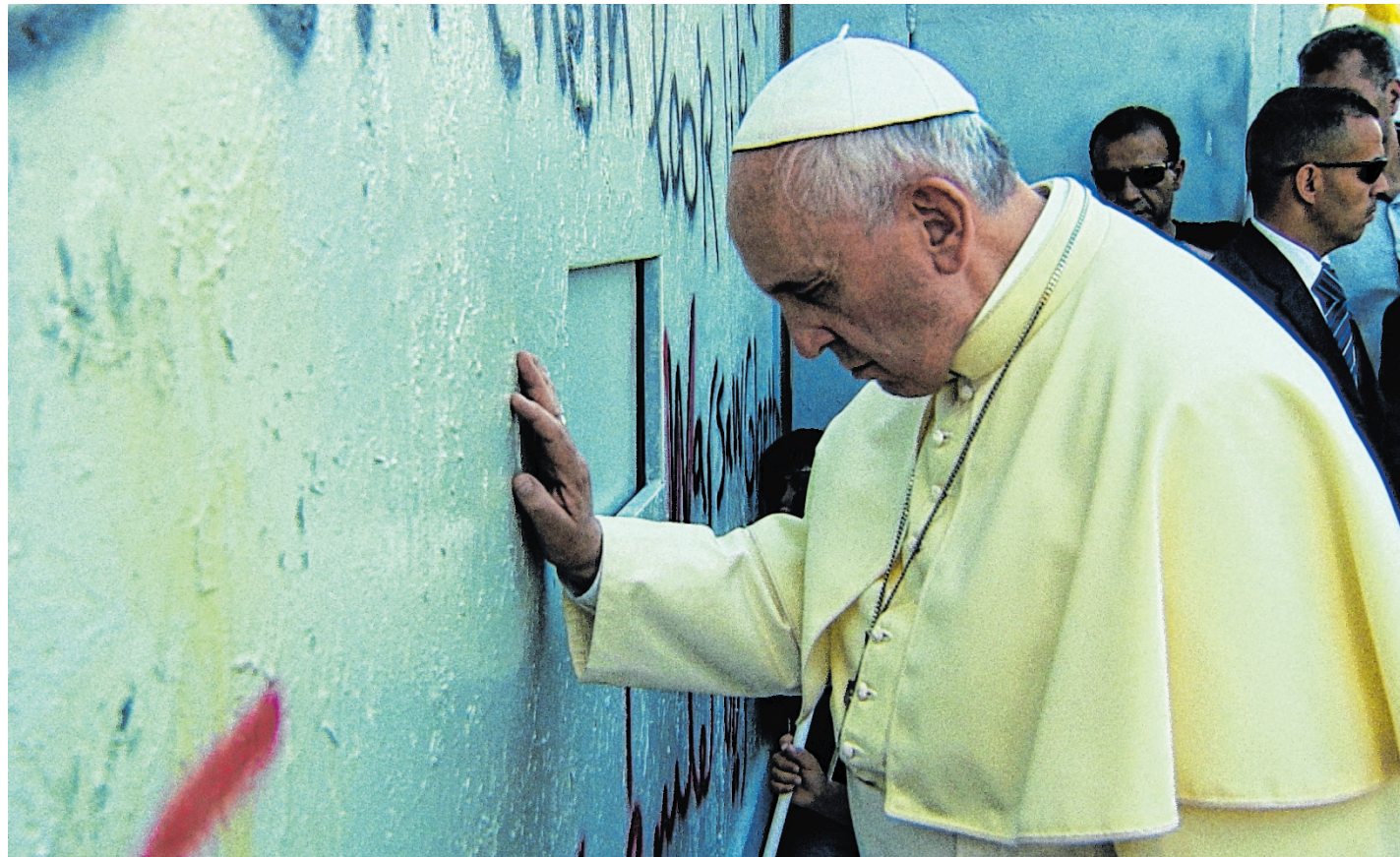
2013 wurde der Argentinier Jorge Mario Bergoglio vom Konklave zum Papst gewählt. Als Franziskus propagiert er seither eine Kirche der Armut.

Der Film wechselt in die Farbe, aus einem Kamin waibert weißer Rauch, ein älterer Herr mit einnehmendem Äußeren tritt auf einen Balkon und sagt in einem Ton, als würde er sein Lieblingsrestaurant betreten, „Buona sera!“. Ähnliches war bis 2013, als sich der 76-jährige Argentinier Jorge Mario Bergoglio als Papst vorstellte, nie zu hören gewesen. Es war der Jesuit Bergoglio der sich an diesem Abend in einen Franziskaner verwandelte. In der Ära der Borgias, die als Serienhelden im Fernsehen die feinen Quoten einfahren, wäre die