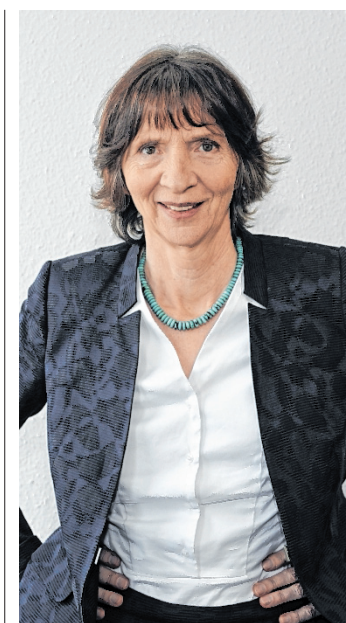
Aleida Assmann ist Literaturwissenschaftlerin, ihr Mann Jan Assmann Ägyptologe. Zusammen werden sie nun ausgezeichnet.