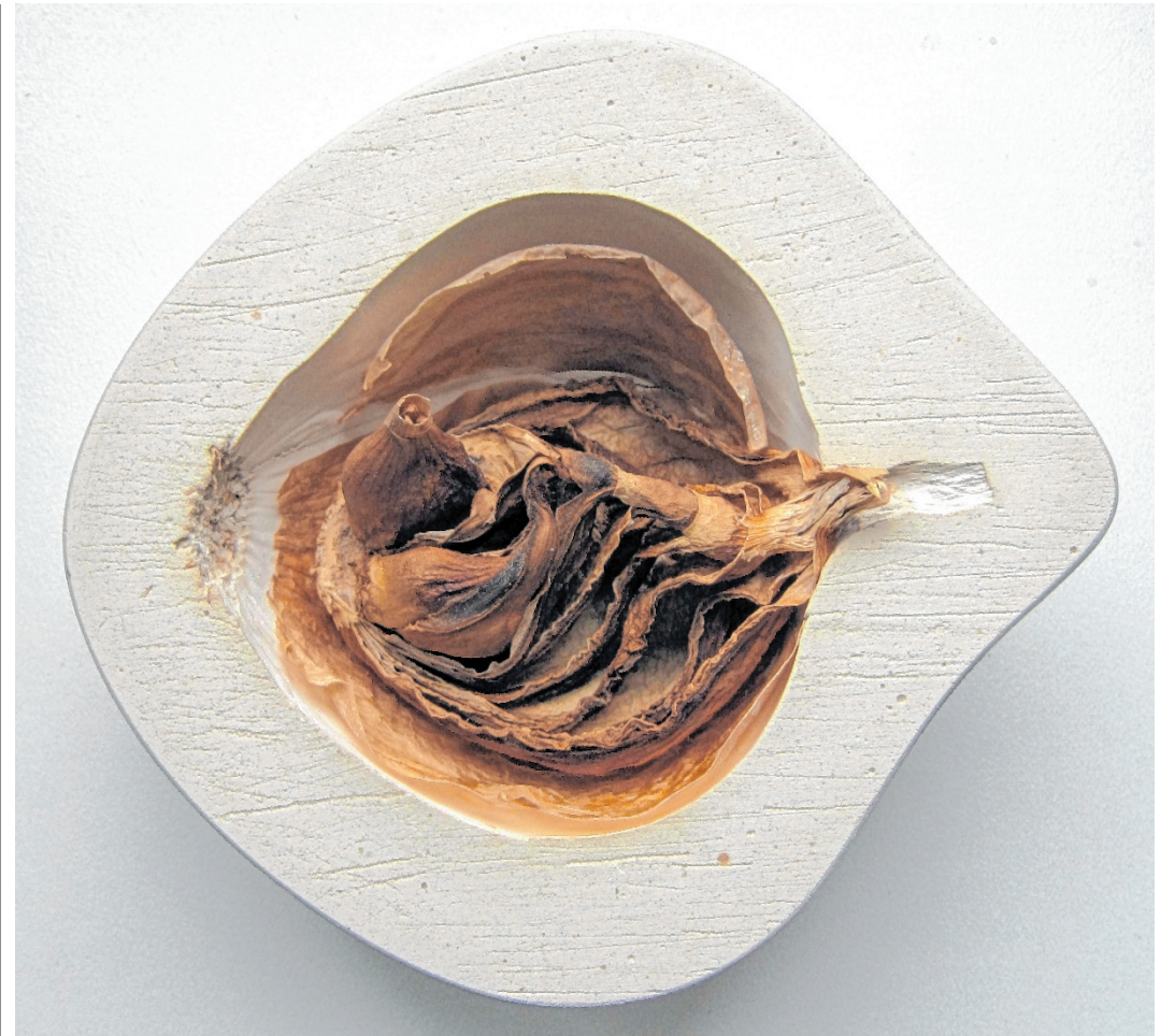
In der Galerie Nothburga: Von Christine Ulm mit Gips umhüllte, inzwischen mumifizierte Zwiebel.

Helene Schnitzer (Tiroler Kulturinitiativen TKI)