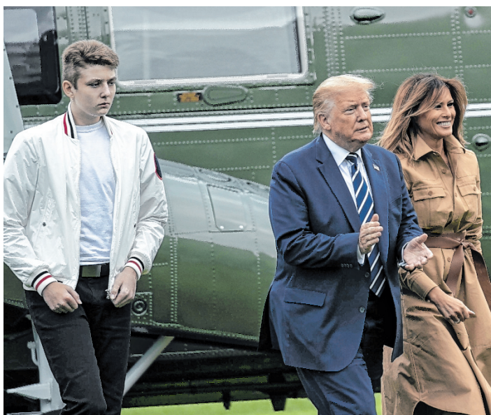
Barron Trump und seine berühmten Eltern, die ganz unterschiedlich mit der Corona-Thematik umgehen.

Während der US-Präsident im Krankenhaus behandelt werden musste, hat bei der First Lady der „natürliche Weg“ gereicht, sie habe sich „mehr für Vitamine und gesundes Essen“ entschieden. „Wenn Sie krank sind oder wenn Sie einen geliebten Menschen haben, der krank ist, denke ich an Sie und werde jeden Tag an Sie denken“, zeigt Melania Trump deutlich mehr Empathie als ihr Gatte. (APA)