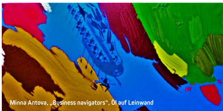
Minna Antova, „Business navigators“, Öl auf Leinwand