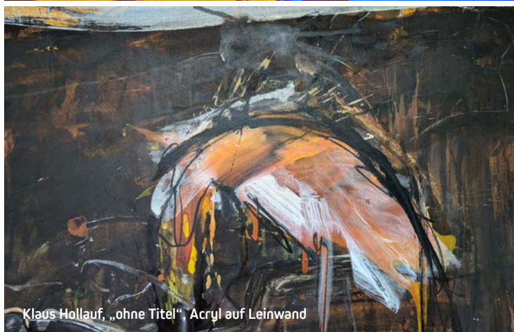
Klaus Hollauf, „ohne Titel“, Acryl auf Leinwand