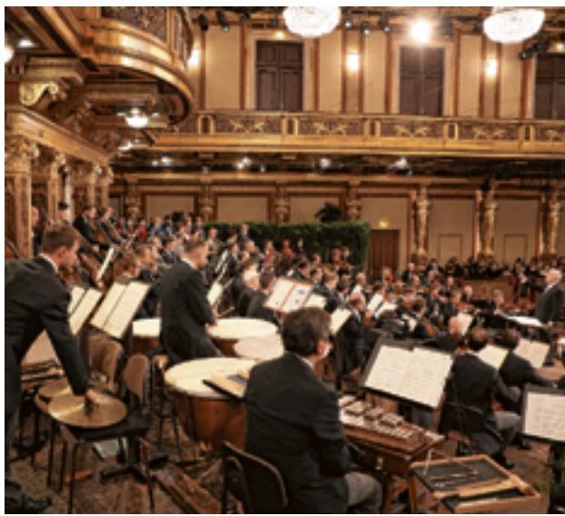
Die Wiener Philharmoniker erinnern an Musikerkollegen, die Opfer des Nazi-Terrors wurden.