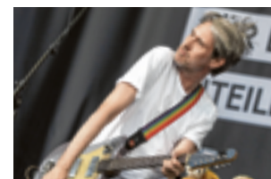
Tocotronic tritt im September in Wien auf.

und 9. September bleibt am ursprünglich angesetzten Termin. Schon die Veröffentlichung ihres aktuellen Albums „Nie wieder Krieg“ verschob die Band wegen der Pandemie um ein Jahr. Es kam im Jänner in den Handel. (dpa)