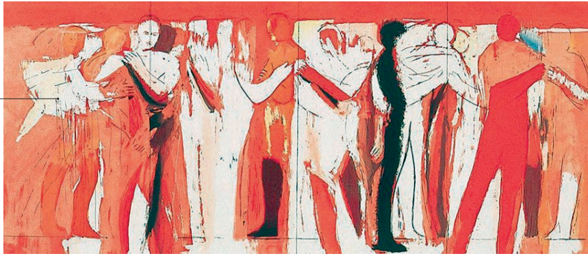
Michael Hedwig „Bewegungen der Seele II“

Geboren 1957 in Lienz, Einzelausstellungen, Ausstellungsbeteiligungen, Teilnahmen an internationalen Kunstmes- sen. Zahlreiche Druck- grafik-Editionen, Projekte im öffentlichen und kirch- lichen Raum.